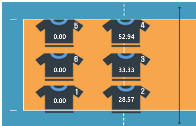
▷ 페퍼저축은행 (박경현)