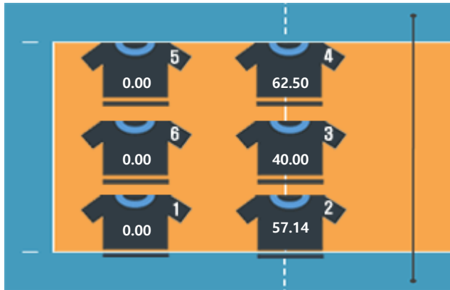
▷ IBK기업은행 (김수지)