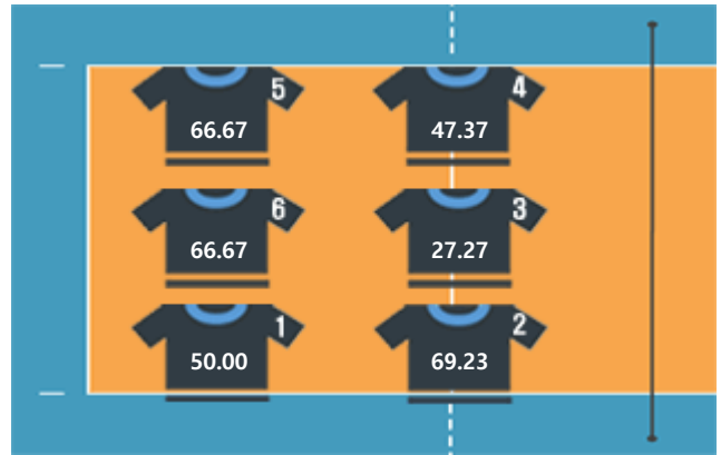
▷ 페퍼저축은행 (엘리자벳)